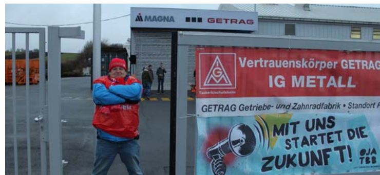
Strikposten bei Magna Getrag Powertrain in Rosenberg