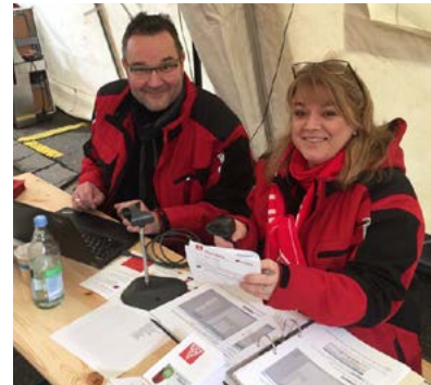
Streikposten bei Saxonia in Göppingen (links), Teilnehmer-Erfassung bei Mahle in Rottweil