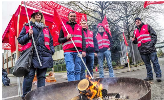
Aktion bei Automotive Lighting und Bosch in Reutlingen