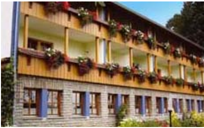
Ferienhaus Bergsicht Scheffau