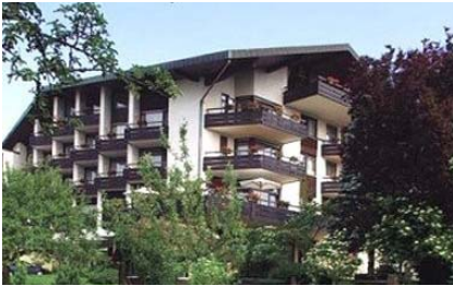
Hotel Schwanen Kälberbronn