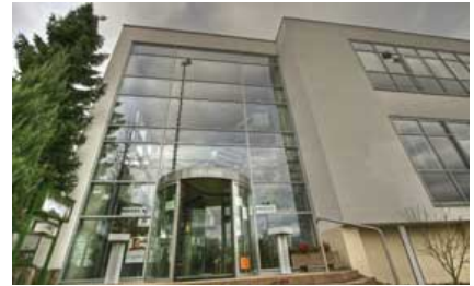
Sport- u. Tagungshotel Kenzingen