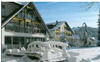
Waldhotel Grüner Baum