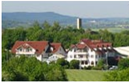
Hotel Empfinger Hof